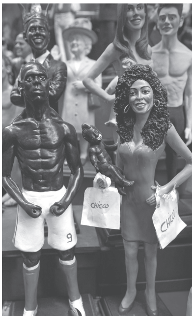
Raffaella Fico con in braccio un bebe' e Mario Balotelli tra le statuine di terracotta proposte a San Gregorio Armeno, la strada del centro storico di Napoli famosa per le botteghe degli artigiani del presepe.

I presepi con bue ed asinello, esposti e in lavorazione, 21 novembre 2012 a San Gregorio Armeno a Napoli. ' Presepe senza bue ed asinello? non se ne parla! ' cosi' hanno commentato gli artigiani della famosa strada nel centro storico di Napoli la notizia tratta dall'ultimo libro di Papa Ratzinger secondo la quale nessun animale era presente al momento della nascita' di Gesu'.